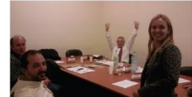
APLICAR EN SU EMPRESA