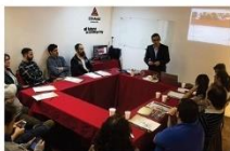
ADQUIRIR UN MÉTODO